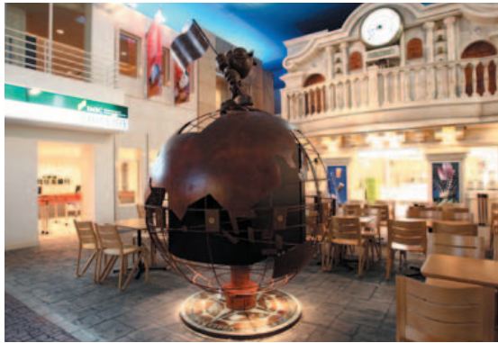
キッズニアの街並み