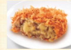
オーマイガーなつかしのポテトコロッケ

NMB48のセカンドシングル「オーマイガー!」の歌詞にちなみ「神戸コロッケ」とのコラボレーションを行いました。限定商品「オーマイガー!なつかしのポテトコロッケ」を10月18日～11月30日まで西日本の店舗で販売、11月2日からは東日本の一部店舗でも販売し、若い世代のお客様からも多くのご支持をいただきました。